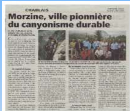
Le Messager 8 juillet