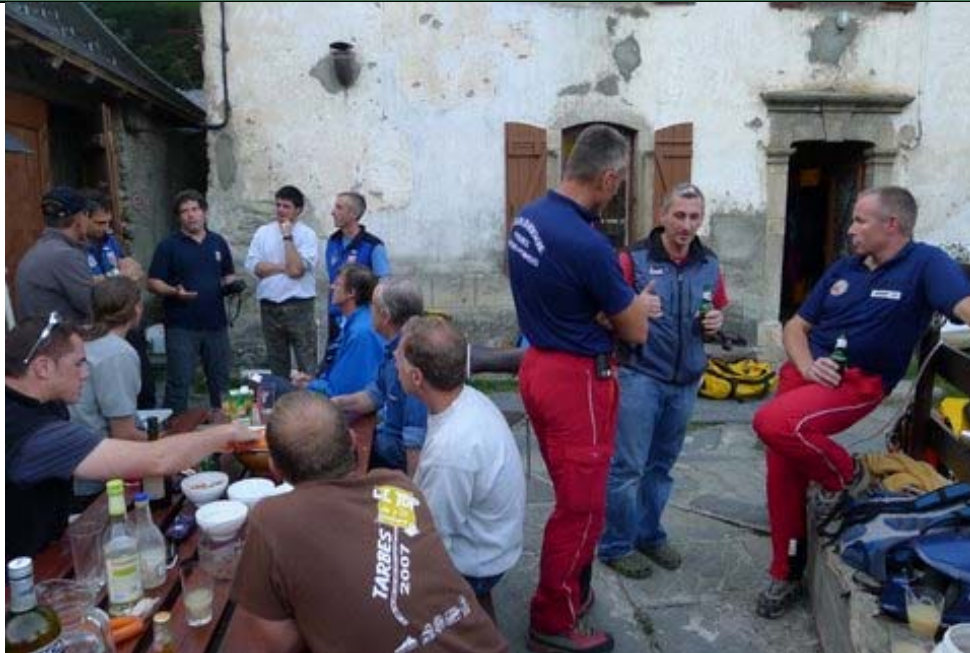
Figure 5 : Rencontre avec le PGHM, les CRS et les pompiers