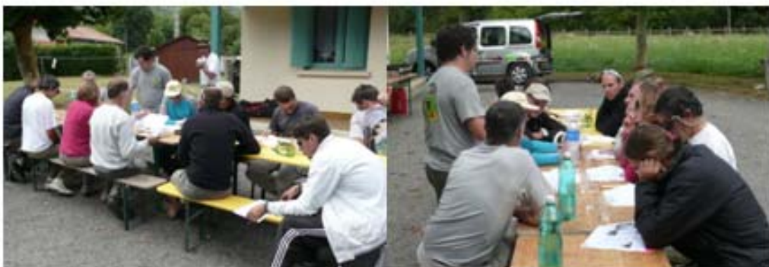
Figure 4 : Fomation Equipement. La théorie