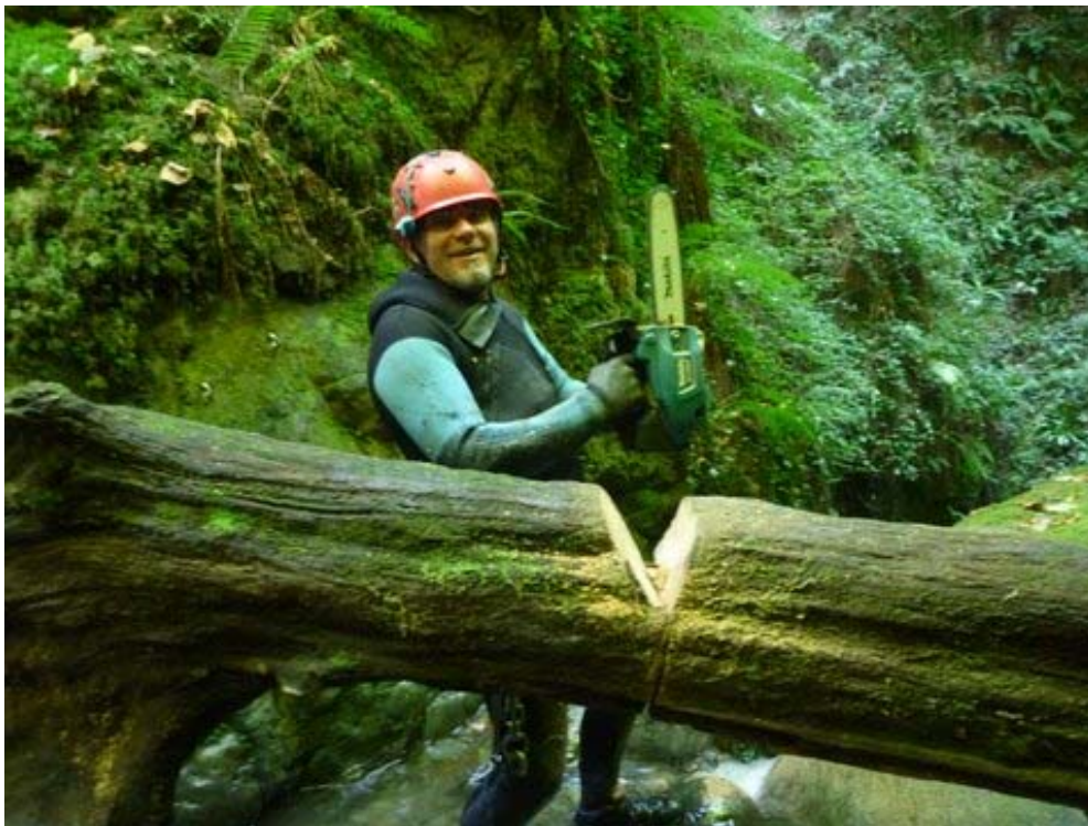
Figure 5 : Déboisement dans le canyon de Mouras