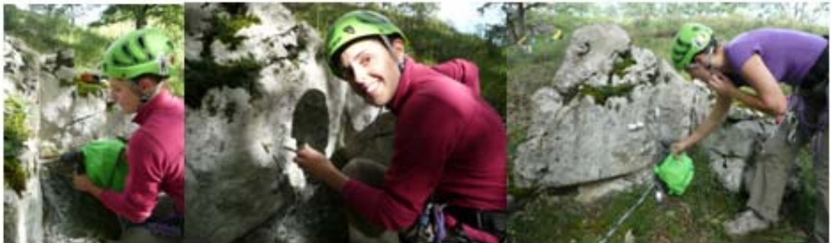
Figure 3 : Fomation Equipement. Installation d'une main courante