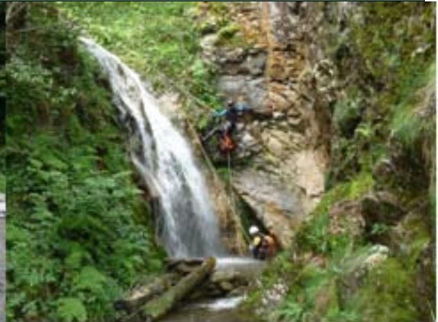
Figure 2 : Fomation Equipement. Installation d'une déviation dans le canyon de Gouaux